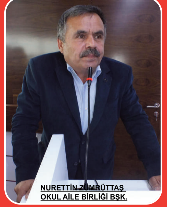
NURETTİN ZURRÜTAS OKUL AİLE BİRLİĞİ BŞK.