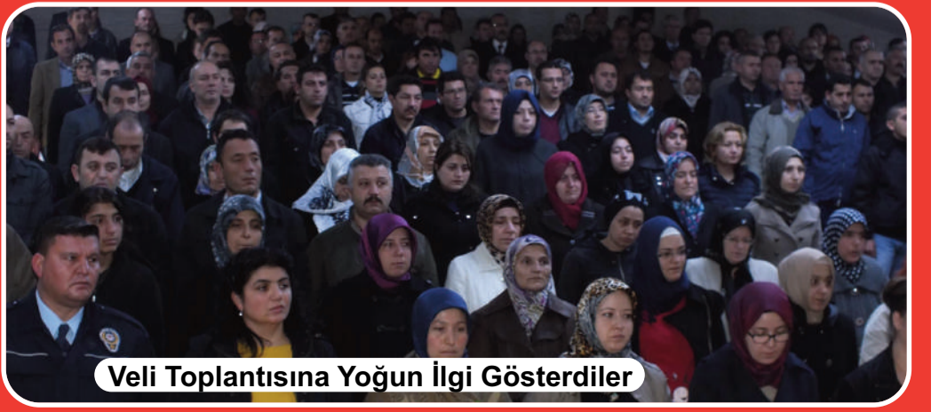
Veli Toplantısına Yoğun İlgi Gösterdiler