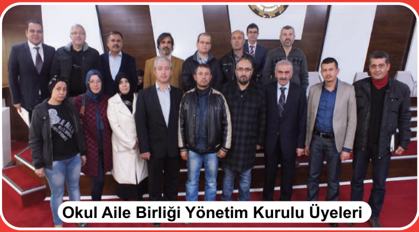
Okul Aile Birliği Yönetim Kurulu Üyeleri