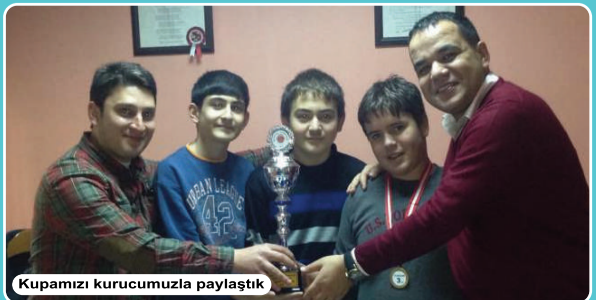
Kupamızı kurucumuzla paylaştık