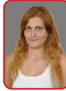
SULTAN DİRİL ALMANCA ÖĞRT.