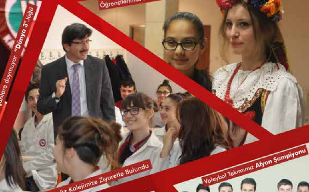
Voleybol Takımımız Atyon Şampiyonu